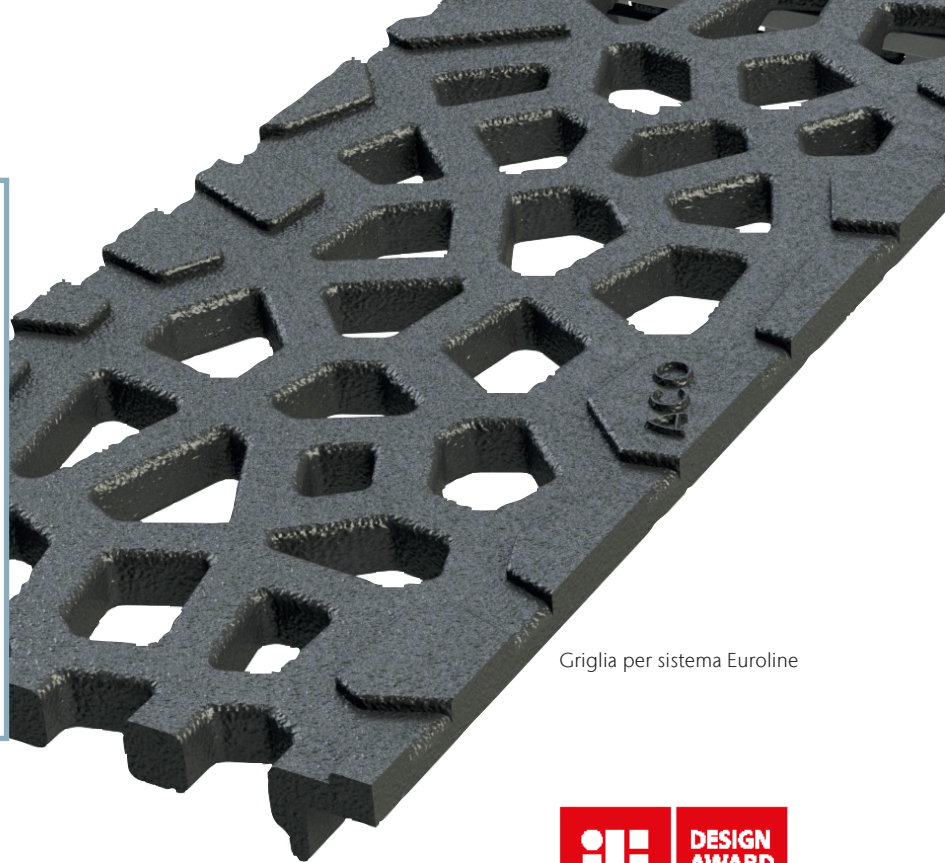
Griglia per sistema Euroline