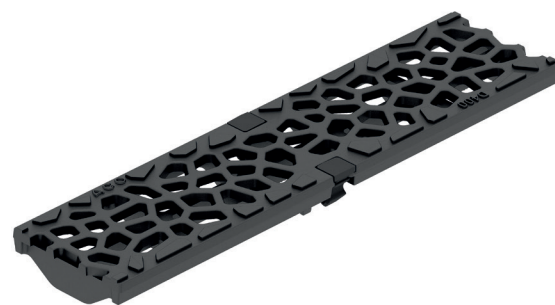
Griglia per sistema Multiline

Come elemento visibile del sistema di drenaggio, questo tipo di copertura contribuisce a realizzare un ambiente scenografico e accattivante.