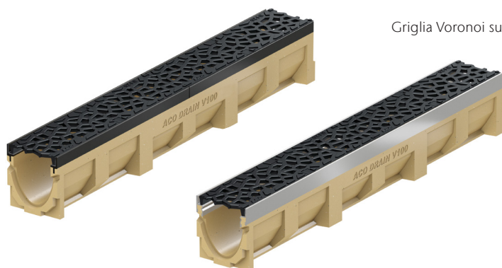
Griglia Voronoi su canali ACO DRAIN Multiline