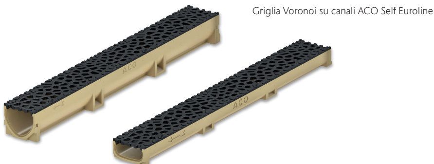
Griglia Voronoi su canali ACO Self Euroline