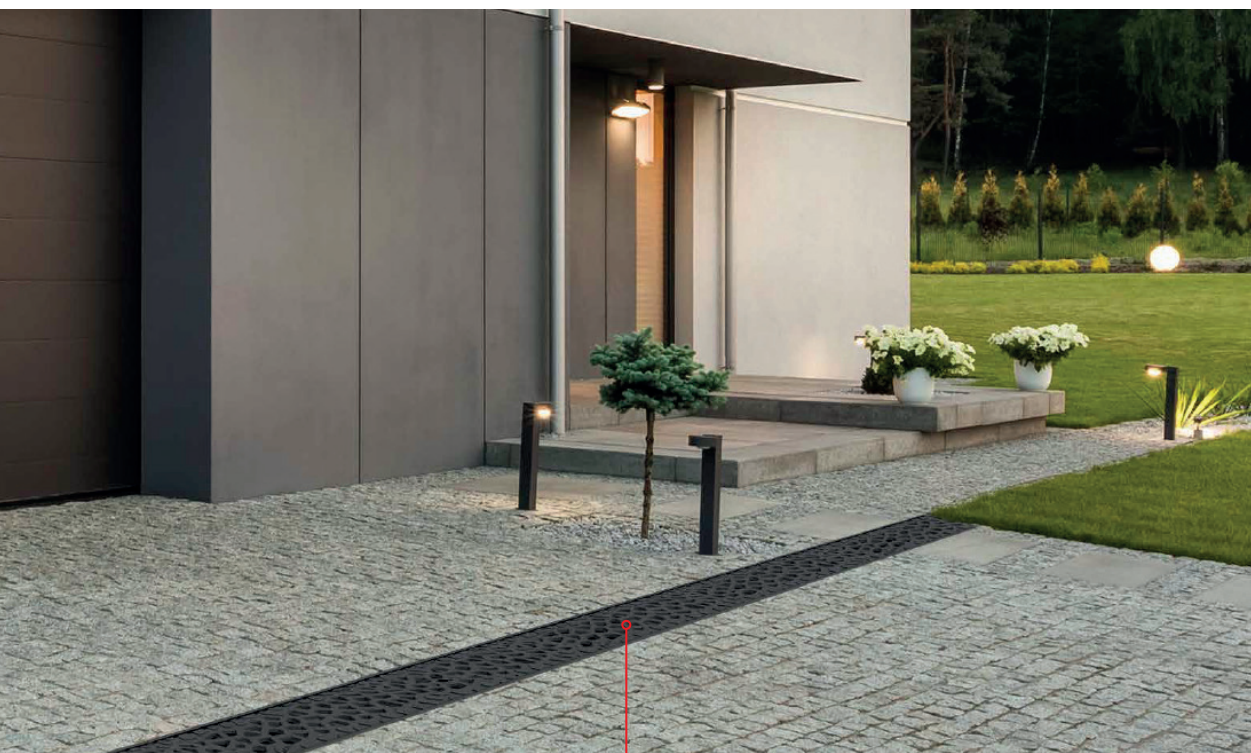
Possibilità di installazione in giardino, cortile o vialetto